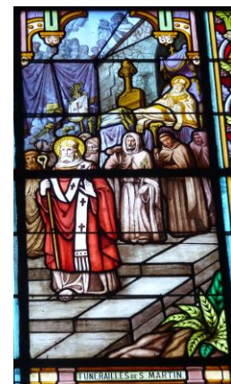
Eglise Saint-Martin-des-Tilleuls - 85

Pour plus d'informations sur l'ensemble de ce programme, adresser un message à loirecheminstmartin@gmail.com