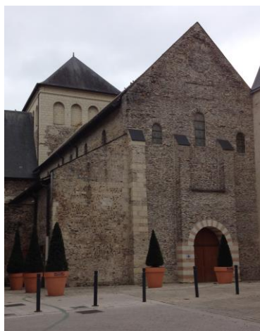
Collégiale Saint-Martin (Angers)