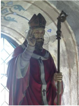
Saint Martin dans l'église de Rivière (37)

Chacun est autonome pour ses repas (petit-déjeuner, déjeuner, dîner). Approvisionnement dans les villages traversés.