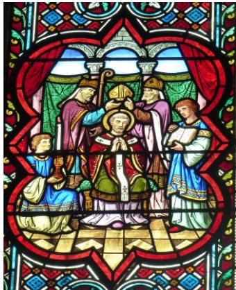
Saint Martin est sacré évêque de Tours (Abbatiale de Saint-Florent-le-Vieil – 49)